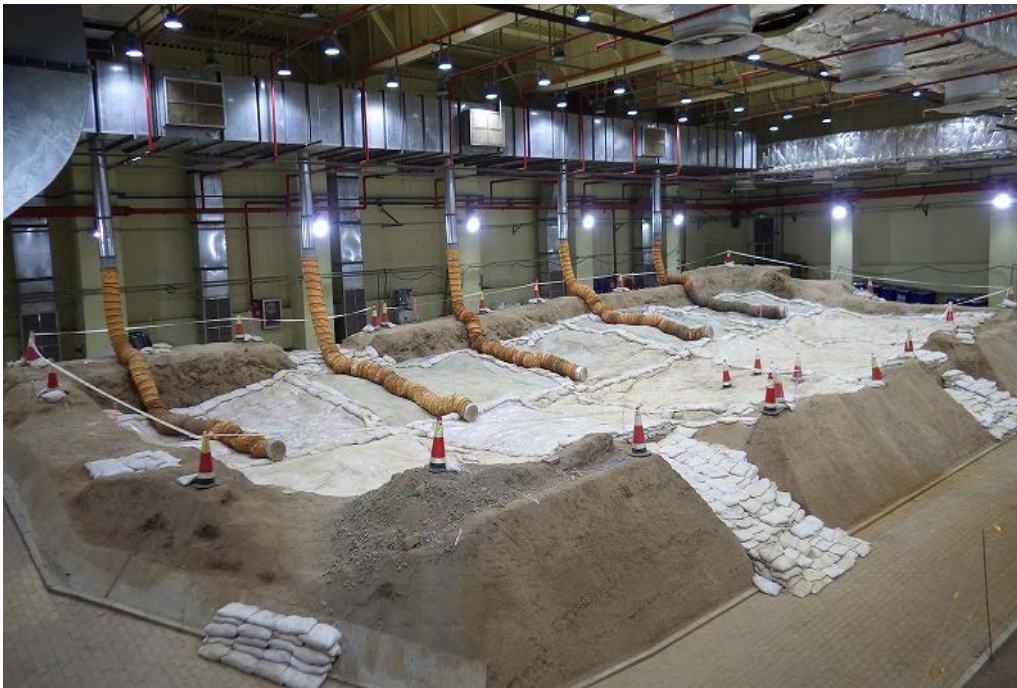
【1号埋設坑】 (2018年度事業終了時点)