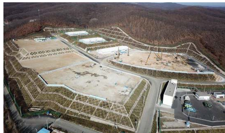
2018年10月末現在状況写真【準備工事完了・杭工事施工中】