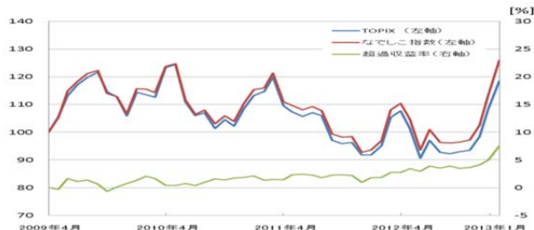
図表3: なでしこ指数とTOPIXの比較

女性活躍に関するスコアが高い72社について、「なでしこ指数」として試算し、TOPIXと比較したところ、ほぼ一貫して「なでしこ指数」がTOPIXのパフォーマンスを上回り、超過収益率の幅が拡大する傾向にありました(図表3)。