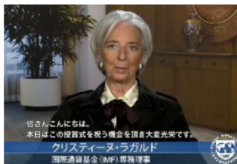
図表3:、ラガルド国際通貨基金(IMF)専務理事から応援メッセージ

また、基本的な考え方と進め方をまとめた「価値創造のためのダイバーシティ経営に向けて」を収録したベストプラクティス集については、書店でも発売しております。（図表 5）