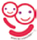
福岡県子育て応援宣言登録マーク

「職場に迷惑がかかるから」、「育児休業が取れるような雰囲気ではないから」などがその主な理由であり、育児休業を取りやすい職場環境が何より大事です。そのためには経営トップの意識と実行の一声(=「宣言」)が最大の効果を持つことから平成15年9月、「子育て応援宣言企業」登録制度を開始しました。