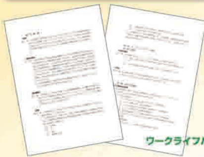
ワークライフバランス規程