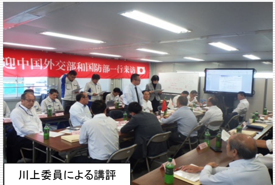
川上委員による講評