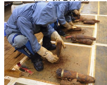
砲弾整備作業 (土、錆を除去)