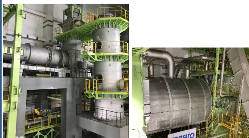
【ロータリーキルン】