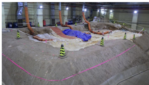
2号発掘棟内部 (2026(令和8)年1月現在)