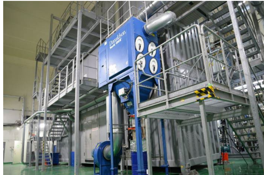
加熱爆破処理設備【川崎重工業株】