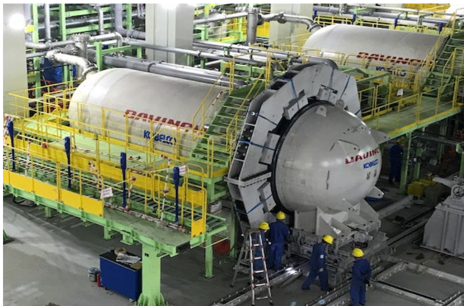
大型廃棄処理設備【株神戸製鋼所】