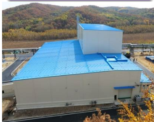
加熱爆破処理施設