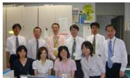
みんな「カエルバッジ」をつけています！

また、かわいい「カエルバッジ」をきっかけに会話が始まりPRすることも。政策企画部内では賛同者が増え、「ノー残業デー」にカエルバッジをつける職員が徐々に増えています。