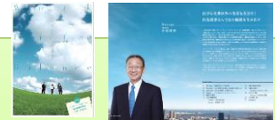
パンフレット(表紙、社長メッセージ)