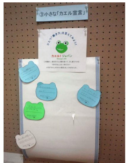
小さな「カエル宣言」に宣言されている様子