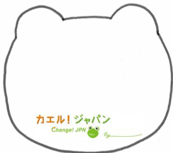
宣言を書き入れるためのカエル用紙 (外側のカエル台紙はオリジナル)

(特集2) http://www.city.minokamo.gifu.jp/home/KOUHOU/pdf/2012_11_1/みのかも_11-01_CS5[08-09].pdf