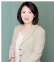
日経 BP 社 日経 BP 総研フェロー