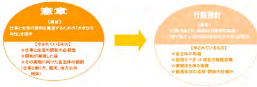
【図表 1 1 4】

憲章、行動指針には、社会全体で取り組むべき方向性や各主体の役割、目標などが示されています。