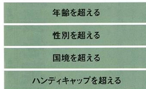
【ダイバーシティ経営の4つの柱】