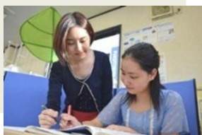
個別教室のアップルの授業(完全1対1)

・身近な人への感謝の気持ちを忘れずにいることが、顧客一人ひとりを大切にすることにつながると考え設定した制度。