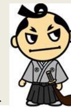
6時間労働制キャラクター「ろくじろう」→