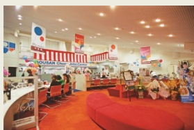
お客様を気配りしやすい弓状カウンター