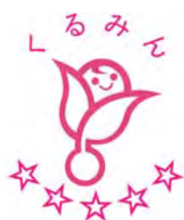
〔認定マーク「くるみん」〕