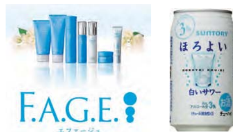
【女性管理職の率いるチームで生まれたヒット商品：「F.A.G.E.」「ほろよい」】