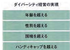
【ダイバーシティ経営の4つの柱】