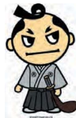
【6時間勤務キャラクター 「ろくじろう」】